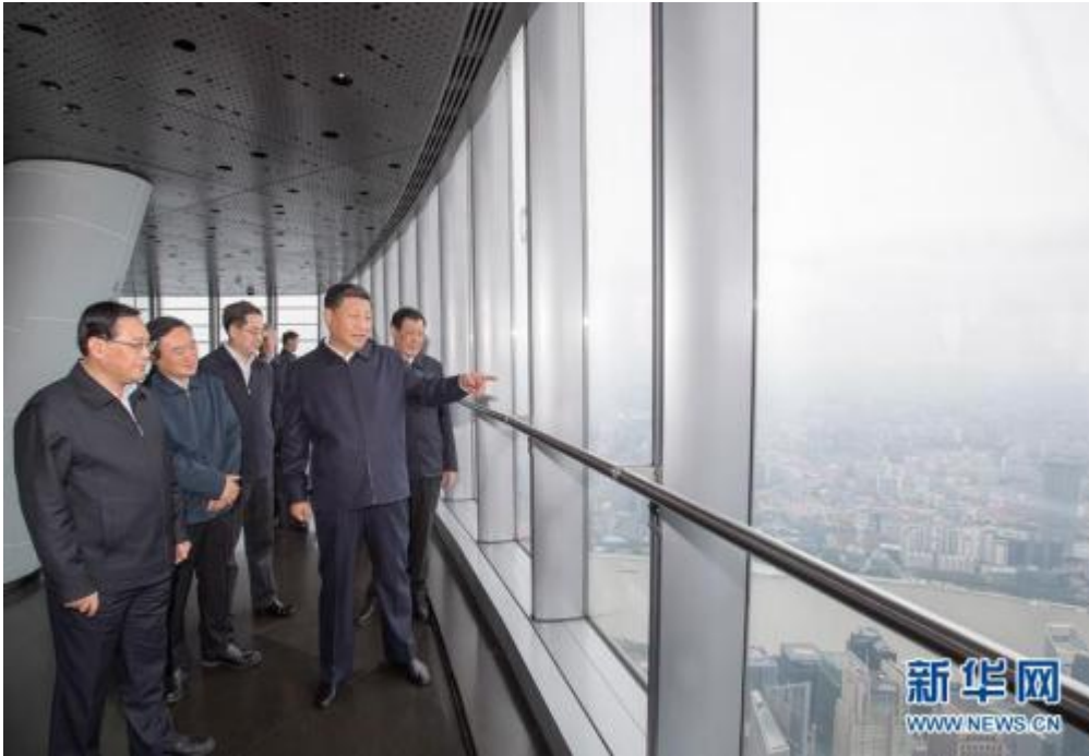
这是习近平在上海中心大厦 119 层观光厅俯瞰上海城市风貌。

随后，习近平来到 119 层观光厅，俯瞰上海城市风貌。东方明珠、环球金融中心、金茂大厦、杨浦大桥、世博园区……处处经典建筑铺展成一幅壮美长卷。大厅内，一幅幅照片今昔对比，生动展示上海百年沧桑巨变。习近平不时驻足观看，同大家交流，回顾上海城市发展历程。他表示，改革开放以来，中国发生了翻天覆地的变化，上海就是一个生动例证。上海是我国最大的经济中心城市和长三角地区合作交流的龙头，要不断提高城市核心竞争力和国际竞争力。要发扬“海纳百川、追求卓越、开明睿智、大气谦和”的上海城市精神，立足上海实际，借鉴世界大城市发展经验，着力打造社会主义现代化国际大都市。