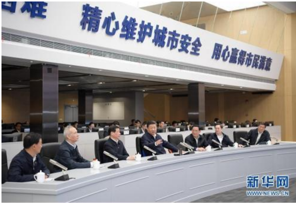
这是习近平在浦东新区城市运行综合管理中心了解上海在推进城市精细化管理方面的做法。