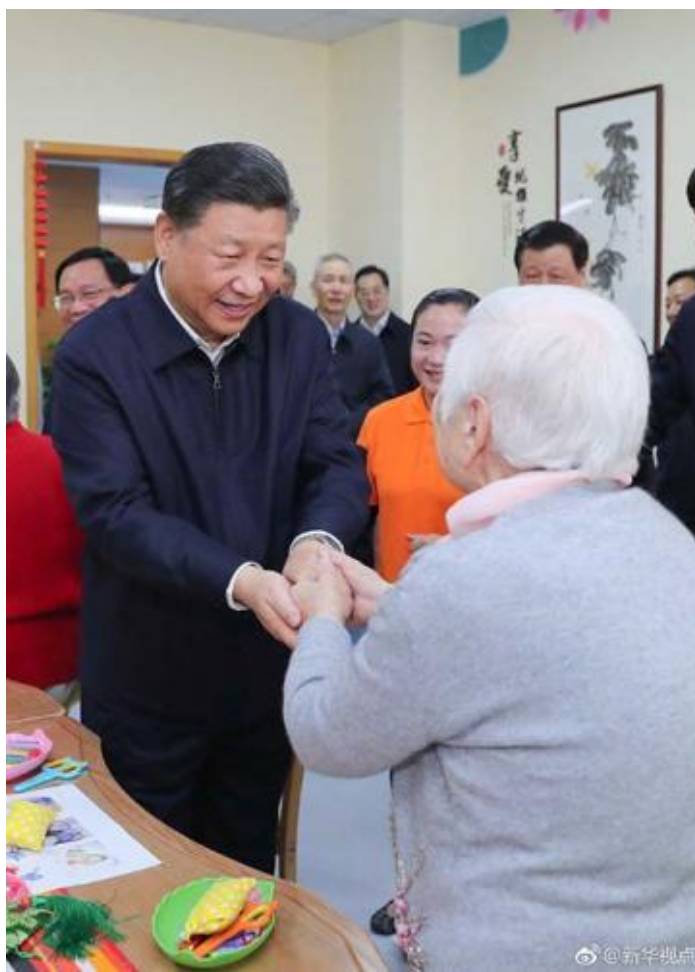
这是习近平在虹口区市民驿站嘉兴路街道第一分站托老所同老年居民亲切握手。

要全民参与，上海要把这项工作抓紧抓实办好。习近平叮嘱他们，城市治理的“最后一公里”就在社区。社区是党委和政府联系群众、服务群众的神经末梢，要及时感知社区居民的操心事、烦心事、揪心事，一件一件加以解决。老百姓心里有杆秤。我们把老百姓放在心中，老百姓才会把我们放在心中。加强社区治理，既要发挥基层党组织的领导作用，也要发挥居民自治功能，把社区居民积极性、主动性调动起来，做到人人参与、人人负责、人人奉献、人人共享。临别时，闻讯赶来的居民簇拥在总书记身边，争相同总书记握手。