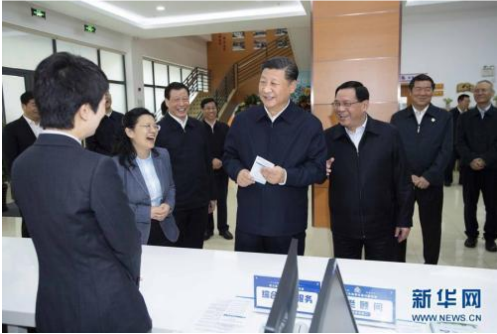
这是习近平在虹口区市民驿站嘉兴路街道第一分站同工作人员亲切交谈。

上海虹口区人口密度大。为满足居民社区生活各方面需求，虹口区设置了 35 个市民驿站，努力打造“15 分钟社区生活服务圈”。习近平走进虹口区市民驿站嘉兴路街道第一分站，逐一察看综合服务窗口、托老所、党建工作站等。托老所内，几位老年居民正在制作手工艺品，总书记亲切向他们问好，老人们激动地握着总书记的手，向总书记讲述自己的幸福晚年。习近平指出，我国已经进入老龄社会，让老年人老有所养、生活幸福、健康长寿是我们的共同愿望。党中央高度重视养老服务工作，要把政策落实到位，惠及更多老年人。市民驿站里，来自居委会、企业的几位年轻人正在交流社区推广垃圾分类的做法。习近平十分感兴趣，仔细询问有关情况。一位年轻人介绍说公益活动已经成为新时尚。习近平强调，垃圾分类工作就是新时尚！垃圾综合处理需