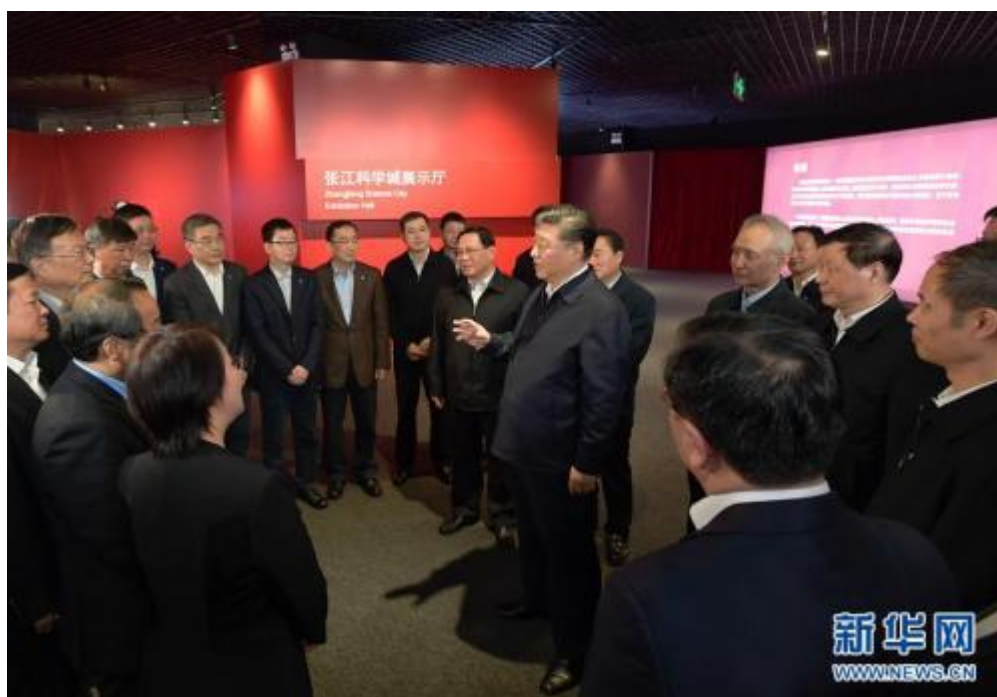
这是习近平在张江科学城展示厅同在场的科技工作者亲切交谈。

刻影响着国家前途命运，从来没有像今天这样深刻影响着人民生活福祉。在实现中华民族伟大复兴的关键时刻，要增强科技创新的紧迫感和使命感，把科技创新摆到更加重要位置，踢好“临门一脚”，让科技创新在实施创新驱动发展战略、加快新旧动能转换中发挥重大作用。要认真落实党中央关于科技创新的战略部署和政策措施，加强基础研究和应用基础研究，提升原始创新能力，注重发挥企业主体作用，加强知识产权保护，尊重创新人才，释放创新活力，培育壮大新兴产业和创新型企业，加快科技成果转化，提升创新体系整体效能。要以全球视野、国际标准推进张江综合性国家科学中心建设，集聚建设国际先进水平的实验室、科研院所、研发机构、研究型大学，加快建立世界一流的重大科技基础设施集群。