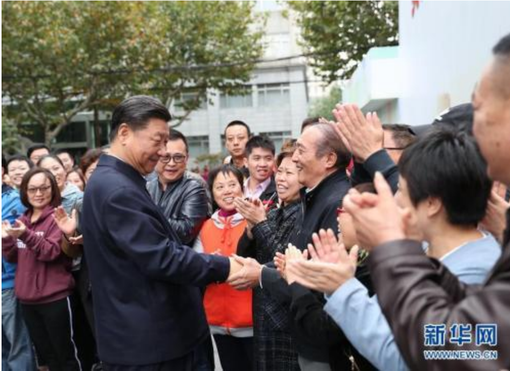
这是习近平在虹口区市民驿站嘉兴路街道第一分站同居民亲切握手。

6日下午，习近平来到浦东新区城市运行综合管理中心，通过大屏幕了解上海城市精细化管理和国际贸易单一窗口运营情况。习近平强调，城市治理是国家治理体系和治理能力现代化的重要内容。一流城市要有一流治理，要注重在科学化、精细化、智能化上下功夫。既要善于运用现代科技手段实现智能化，又要通过绣花般的细心、耐心、巧心提高精细化水平，绣出城市的品质品牌。上海要继续探索，走出一条中国特色超大城市管理新路子，不断提高城市管理水平。