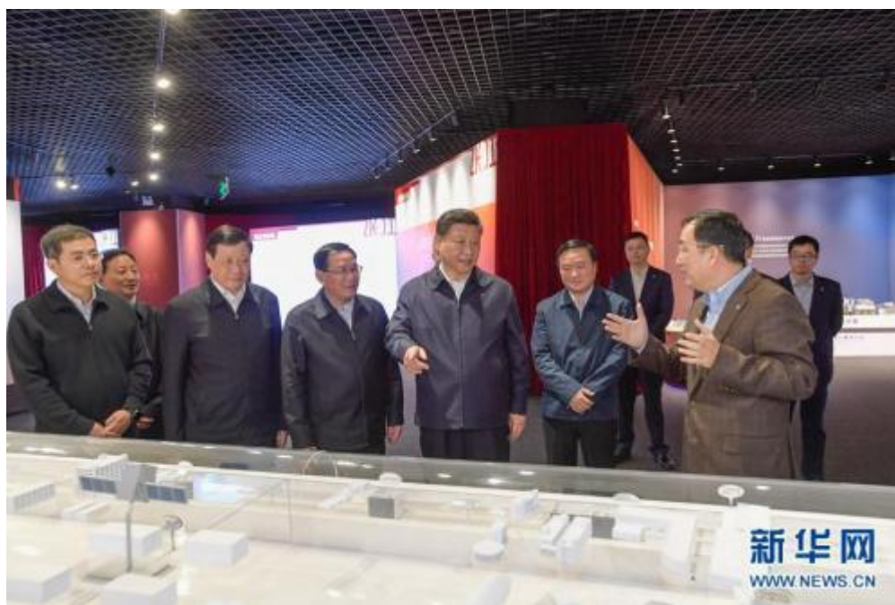
11月6日，中共中央总书记、国家主席、中央军委主席习近平在上海考察。 这是习近平在张江科学城展示厅考察。

济强国必定是海洋强国、航运强国。洋山港建成和运营，为上海加快国际航运中心和自由贸易试验区建设、扩大对外开放创造了更好条件。要有勇创世界一流的志气和勇气，要做就做最好的，努力创造更多世界第一。他希望上海把洋山港建设好、管理好、发展好，加强软环境建设，不断提高港口运营管理能力、综合服务能力，在我国全面扩大开放、共建“一带一路”中发挥更大作用。