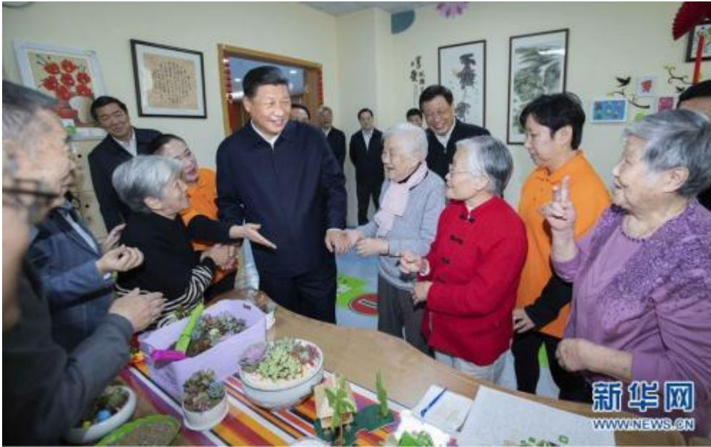
这是习近平在虹口区市民驿站嘉兴路街道第一分站托老所同老年居民亲切交谈。